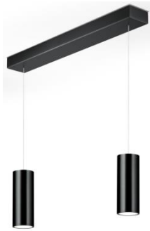
HELLI Pendelleuchte 51.506.xx 4 x 8 W LED, 2.700 K, 4.280 lm, EEL-E