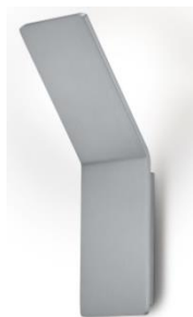
21.851.xx 10 W, 850 lm, 2.700 K EEL-F