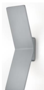
21.852.xx 2 x 10 W, ges. 1.700 lm, 2.700 K EEL-F